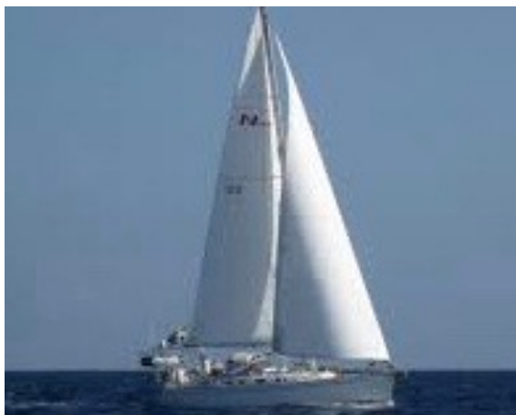
Najad 42.an the Flying Penguin på väg över havet mot Bahamas...