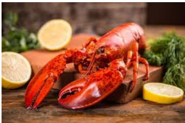
Hummer är en stor sak utanför Maines kust fick vi lära oss...

Där blev det helt nödvändigt att söka skydd undan orkanen Irene som drog fram osannolikt långt norrut och bl a drabbade New York med full kraft.